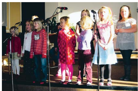
Röststark barnkör i missionskyrkan.